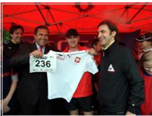
Burmistrz honorowym uczestnikiem sztafety