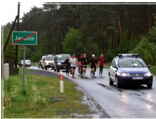
Polska (i Jarocin) biega

Czy jest możliwe, aby po jarocińskich ulicach pobić z dwukrotnym złotym mistrzem olimpijskim Tomaszem Kucharskim czy mistrzem Europy w biegu przez płotki Pawłem Januszewskim? Jak najbardziej! Na pewno było to możliwe w środę 6 maja. Średnio każdy z nich biegnie 20 km dziennie, w każdą pogodę, od rana do wieczora bez względu na to czy są wielkimi mistrzami, ikonami polskiego sportu czy zwykłymi studentami. Łączy ich sportowa pasja, która w środę 6 maja przygnała ich do Jarocina.