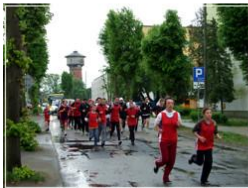
Jarocińska pobięta razem z Mistrzami