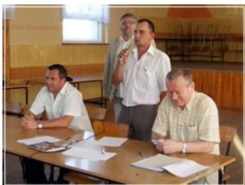
Tuż po ogłoszeniu wyników wyborów nowy sołtys podziękował mieszkańcom wsi za poparcie

Najkorzystniejszą ofertę złożyło Budownictwo 2010-07-26 | Nowy sołtys w Łuszczanowie